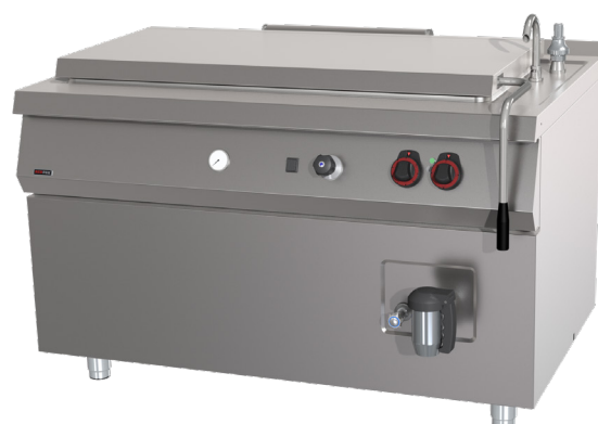
BIQ 90/140 300 E, G