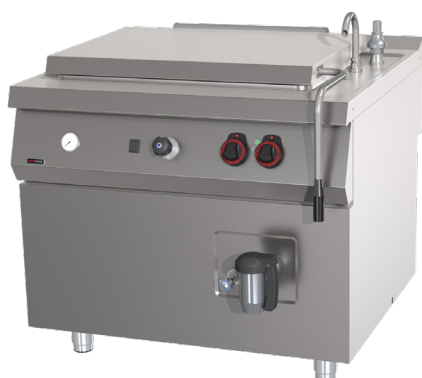
BIQ 90/100 200 E, G